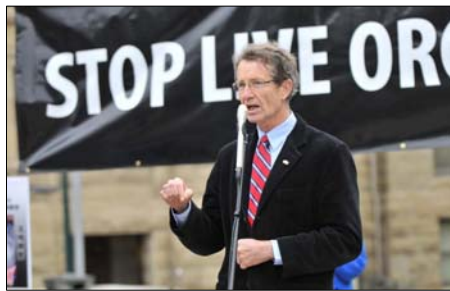
图：亚省省议员大卫·斯旺博士发言

亚省省议员，前自由党领袖大卫·斯旺博士在集会上呼吁加拿大政府对中共迫害法轮功修炼者事件进行调查，必须制止这一长期的迫害。“与一个无论是制度、劳工、环境以及人