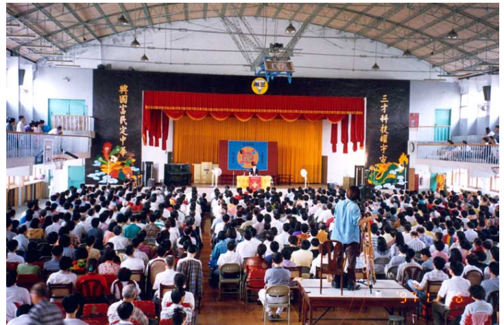
李洪志师父于一九九七年十一月在台北三兴国小讲法

一九九九年四月二十五日，超过万名法轮功学员在北京中南海和平上访，该事件经媒体大幅报导，把法轮功推向了世界舞台。同年七月二十日中共江氏集团展开大规模打压，法轮功学员遭到严重迫害，该事件经台湾媒体披露后，法轮功的知名度迅速传开，由于免费教功，