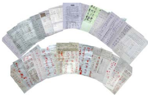
图：第四轮河北 1108 民众声援

700 手印亮相美国国会后,河北省政法委高层官员驻扎当地实施恐怖调查行动,两人一组逐户追问,威胁民众“谁签名,谁好不了”。专管 610 (专门迫害法轮功的非法组织)的副县长、正定公安局副局长高国开始疯狂抓捕,发生了至少六起绑架行动,造成其中一名法轮功学员杨银桥坠楼身亡。共 16 位法轮功学员及家属遭绑架,被套上黑头套绑至正定县