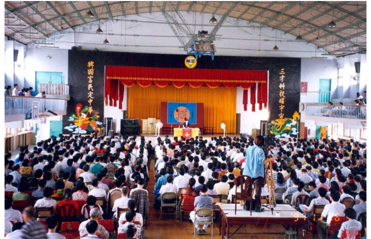
李洪志师父于一九九七年十一月在台北三兴国小讲法

一九九九年四月二十五日，超过万名法轮功学员在北京中南海和平上访，该事件经媒体大幅报导，把法轮功推向了世界舞台。同年七月二十日中共江氏集团展开大规模打压，法轮功学员遭到严重迫害，该事件经台湾媒体披露后，法轮功的知名度迅速传开，由于免费教功，