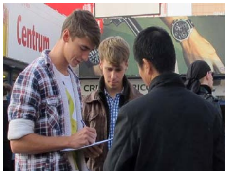
图：波兰各界人士踊跃签名

【明慧网】二零一二年十月十二日至二十三日，波兰法轮功学员在华沙市中心地铁广场揭露中共对法轮功十三年来的残酷迫害，特别是中共活摘器官、并将尸体加工贩卖牟利的滔天罪行，征集签名反迫害。征签台前常常排起长队，所有参与征签的人都共同发出一个声音：呼吁联合国行使职权，尽快开展独立调查，制止中共的反人类邪恶暴行。◇