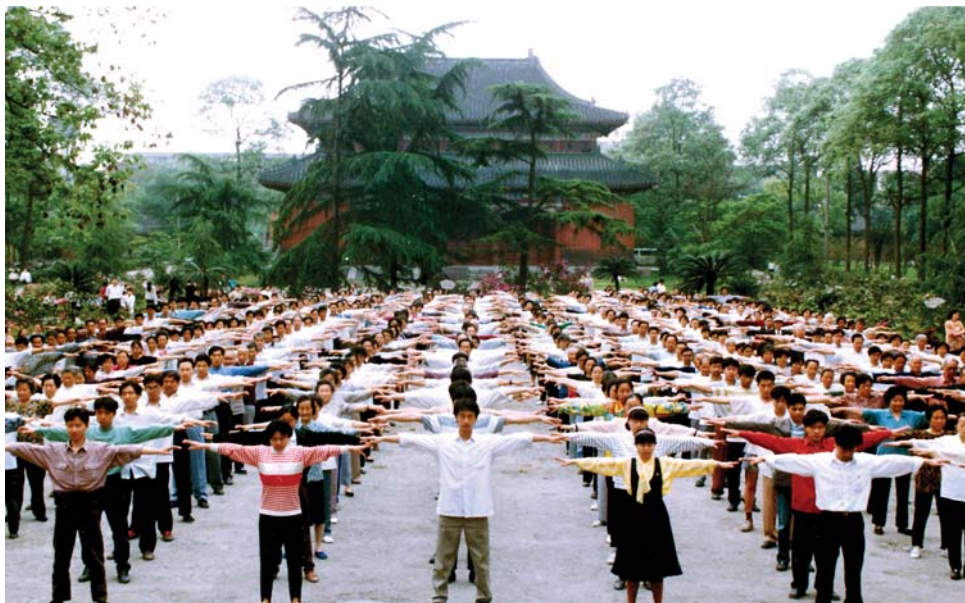
历史图片：1999年迫害发生前四川成都法轮功学员集体炼功

母身边。第二天，我对家人说，我现在的精神状态极差，我不知道自己接下来会怎么样，这次能回来见到你们我很高兴，我一直怕不能回来见你们了。我母亲和我妹妹们修炼法轮大法有半年了，她们告诉我别担心，说我这个病国外先进的医疗治疗不了，国内的中医、一般的气功也解决不了，只有修炼法轮大法，才能真正救了我。我从小受中共邪党无神论的教育，对修炼没有任何认识，但心里却非常肯定地感觉到只有法轮大法能救我。从此我走上了修炼法轮大法的神圣之路。