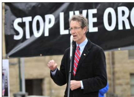
图：亚省省议员大卫·斯旺博士发言

亚省省议员，前自由党领袖大卫·斯旺博士在集会上呼吁加拿大政府对中共迫害法轮功修炼者事件进行调查，必须制止这一长期的迫害。“与一个无论是制度、劳工、环境以及人权等方面都不同的国家交易，不利于加拿大人民的福祉。”