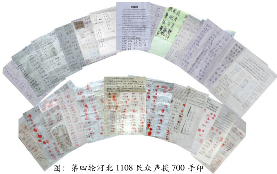
图：第四轮河北 1108 民众声援 700 手印

露了中共邪恶的本质,失尽民心。截至目前,又有 1108 名(其中 622 人按上了自己的手印)知情世人站出来声援法轮功,抵制中共的疯狂迫害。