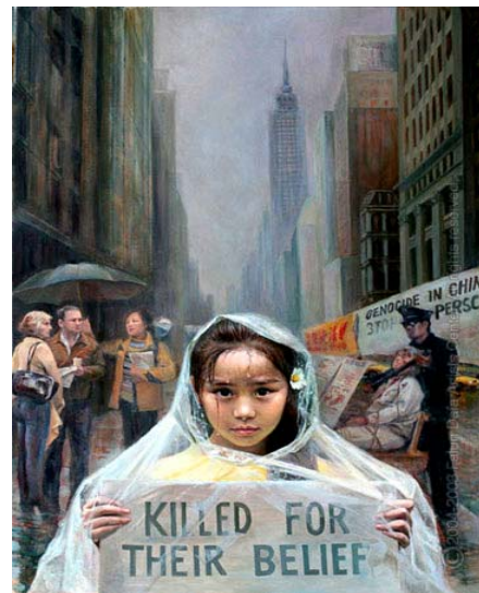
真善忍国际美展作品雨中的呼唤

警察的职责本应该是保护人民人身、财产安全的。这些恶警听从中共邪恶指令，专门迫害善良的百姓，绑架好人，是真正的在违法犯罪。中共邪教惧怕善良，利用各种借口迫害善良百姓。抚顺市和清原县恶警的恶行是公开的对法律的践踏，是社会动乱的制造者。只有在中共邪党政权的国家才会有这样的事情发生。清原老百姓又一次亲眼见证了中共利用共产邪教破坏法律实施的恶行。我们希望抚顺市和清原县警察认清中共这个杀人恶魔。拒绝参与迫害善良的法轮功学员，为自己留一条后路。曝光跟随江泽民流氓集团的邪恶参与迫害法轮功学员的罪恶。为了人类的正义，为了人类未来的美好，为了中国人民都不再被邪党迫害，在这历史变化中做出正确的选择。