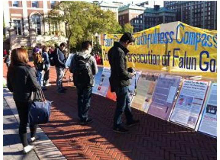
图：哥伦比亚大学学生驻足了解法轮功真相

展览过程中，也有不少来自中国的学生学者驻足阅读。绝大多数中国学生学者都对法轮功学员报以微笑鼓励，还有学生在经过展板时竖起两个大拇指，给法轮功学员加油。有一位来自中国的学生在展板前看了很长时间，之后主动与展览的志愿者交流。她首先表示迫害法轮功是绝对错误的，但是还存在“法轮功参与政治”的观念。志愿者指着真相点的横幅（横幅上写着“停止对法轮功的迫害”）表示，从一九九九年迫害发生以来的十三年中，没有发生过任何一起法轮功学员的过激行为，我们没有任何政治目的，对政权不感兴趣，我们的横幅写得很清楚，“停止迫害”是我们的唯一诉求。这位中国学生表示理解，志愿者将《九评共产党》介绍给她，