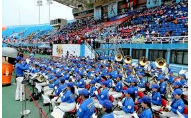
天国乐团作为大会乐队，为大赛演奏“开幕乐”、“欢乐颂”，“法正乾坤”等组曲。

除了身着古装的天国乐团在一开场引领选手们进场外，还有一组天国乐团成员身着西式服装作为大会伴奏乐队，演奏“欢乐颂”、“法正乾坤”等组曲，并为大赛演奏“开幕乐”。天国乐团两个