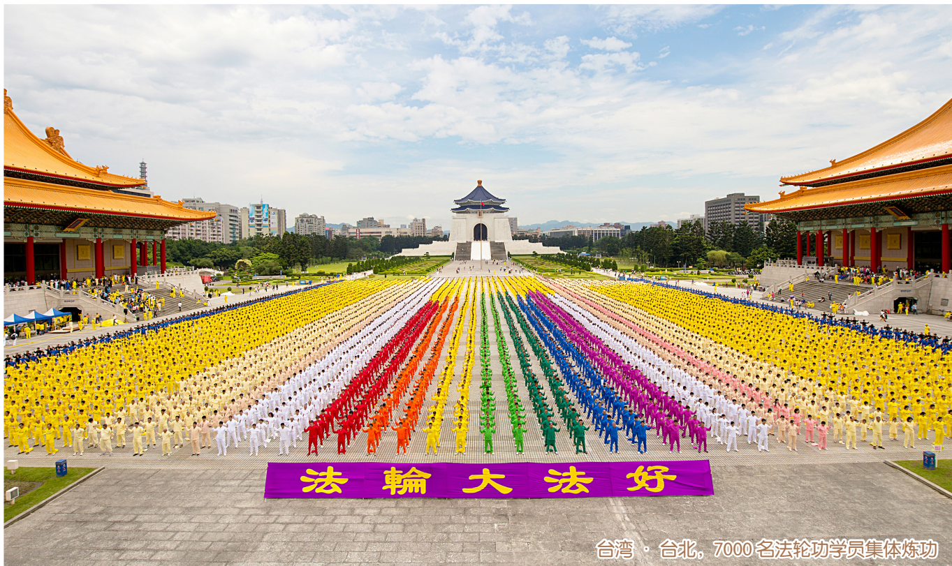
台湾·台北，7000名法轮功学员集体炼功