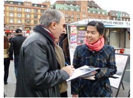
丹麦首都民众签名 谴责活摘器官