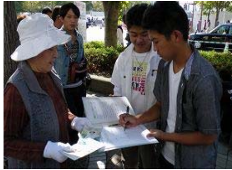
日本东广岛市第二十三届酒节