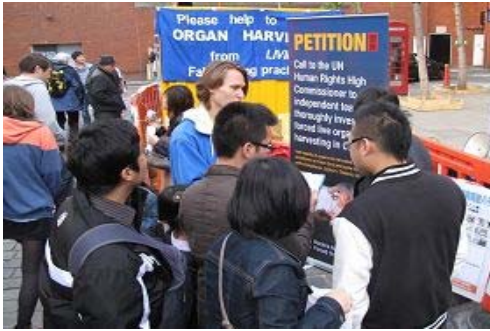
法轮功学员在伦敦唐人街举办劝三退、反活摘器官征签活动, 吸引许多中、西方民众驻足了解真相

用海外电子信箱给 freeget.ip@gmail.com 发电子邮件, 10 分钟内会拿到几个 IP 地址。突破网络封锁, 访问明慧网 www.minghui.org 了解更多真相!