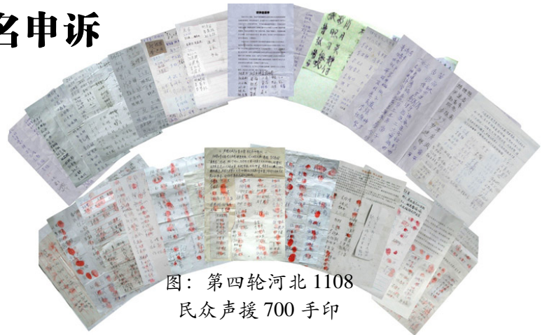
图：第四轮河北 1108 民众声援 700 手印

恐怖迫害的结果适得其反, 更暴露了中共邪恶的本质, 失尽民心。截至目前, 又有 1108 名 (其中 622 人按上了自己的手印) 知情世人站出来声援法