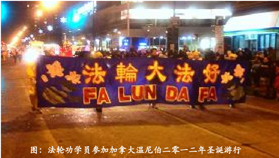
图：法轮功学员参加加拿大温尼伯二零一二年圣诞游行