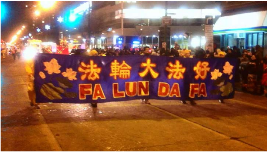
图：法轮功学员参加加拿大温尼伯二零一二年圣诞游行