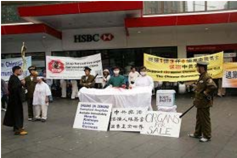
悉尼声援三退集会现场, 揭露中共迫害法轮功的模拟演示