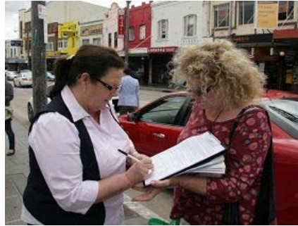
民众签名制止中共活摘法轮功学员器官的暴行

(明慧记者蕴韵澳洲悉尼报道) 二零一二年十二月二日中午, 各界民众在悉尼市中心乔治大街唐人街附近举行集会, 庆祝一亿两千八百万中国人声明退出中共的党、团、队组织 (简称“三退”), 呼吁更多的华人同胞了解真相, 抛弃中共, 迎接即将