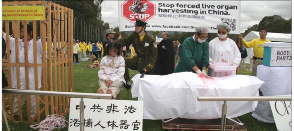
图：国会大厦前模拟演示，揭露中共酷刑迫害法轮功学员并活体摘取器官。

来自美国的智库研究员伊森·葛特曼先生是作家及研究者，也是调查法轮功学员和其他一些政治犯被中共活摘器官的主要独立调查员之一，同时是《失去新中国》一书的作者及《亚洲华尔街日报》等刊物的撰稿人。他与悉尼大学药理学和运动科学教授菲尔特罗内·辛格在研讨会上就中共谋杀法轮功学员，非法摘取和出售他们器官的指控及对指控进行的调查做了详尽的介绍。