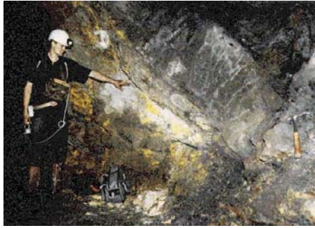
图：美国航天局 2005 年 2 月 20 日公布 20 亿年前的核反应堆图片。

法国政府宣布了这一发现，震惊了世界，并吸引了各国的科学家们来到奥克洛研究，研究成果在 1975 年国际原子能委员会的一个会议上公布：这是一个大型的、天然核反应堆，由六个区域约 500 吨铀矿石构成，输出功率估计为 100 千瓦。核反应堆为二