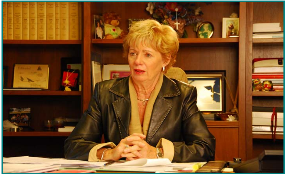
图：加拿大国会议员、国会法轮功之友成员朱迪·斯格诺

她说：“我们需要更多人签请愿书制止活摘器官，并在加拿大和世界各地加强呼吁，我们需要更多的人。需要我们的政府站出来，为人权而战。