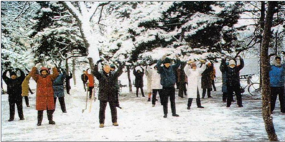
图：一九九六年长春法轮功学员集体炼功