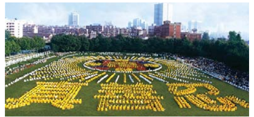
1997年武汉法轮功学员排字炼功

从此我的人生不再消沉，心中时常为自己能得大法感到荣幸，自豪。很多了解我过去的亲友见到我，都用赞许的口吻说：“你咋像变了一个人似的呢？”我说我炼了法轮功，他们都为我高兴，更为法轮功的力量感到神奇。