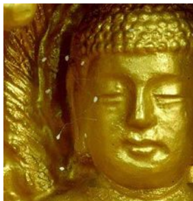
图：韩国全罗南道顺天市海龙面的须弥山禅院的佛像上长出的优昙婆罗花。

人间一大盛事。佛经上记载着这种“优昙婆罗花”预示着法轮圣王（又称转轮圣王）在世间传法度人。1997年，传说三千年一开的“优昙婆罗花”在韩国首次被发现，之后，中国大陆、香港、台湾、澳大利亚、美国加州、纽约、德克萨斯州休士顿等国家和城市又有发现。尤其在中国，优昙婆罗花更是大面积地开放。