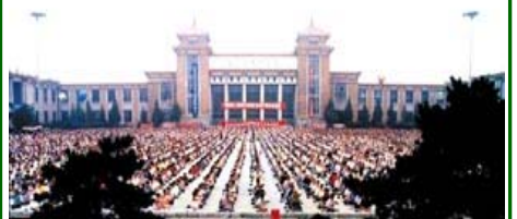
(图片: 1999 年中共迫害法轮功前、沈阳万人大炼功场面壮观。)

而 1999 年 10 月 30 日由全国人大及常委会制定的《关于取缔邪教组织, 防范和惩治邪教活动的决定》, 也只是对“邪教”的认定与处罚, 根本就没说过“法轮功是×教”。2005 年 4 月 9 日, 公安部颁布《关于认定和取缔邪教组织若干问题的通知》(公通字[2005]39 号)。该文件附件中说, “1983 年开始, 公安部多次部署开展集中查禁取缔工作, ……到目前为止, 共认定和明确的邪教组织有 14 种。(在百度或其它网站中输入“公安部认定的邪教组织”就可查到这个名单)。这是到目前为止关于邪教认定最新的一个正式文件。公安部在认定邪教组织时, 明确是根据《刑法》和一系列 (转下页)