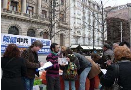
签字声援法轮功反迫害

【明慧网】二零一二年十二月十五日下午四点, 西班牙法轮功学员在萨拉格萨市中心最繁华的商业中心广场上举行反迫害征签活动, 揭露中共活摘法轮功学员器官的罪行, 同时声援一亿二千九百万中国同胞退出中共邪党组织。