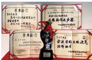
图：93年北京健康博览会上，李洪志先生获“边缘科学进步奖”和“受群众欢迎气功师”称号。

区（包括台湾、香港、澳门），法轮功的书籍被译成30多种语言出版发行，并可在互联网上免费下载。李洪志先生和法轮大法获得各国政府各类褒奖、支持决议案和信函超过3000项。“真善忍”的信仰得到了各族裔民众的爱戴和尊敬，却在中國大陸一地受到残酷迫害。◇