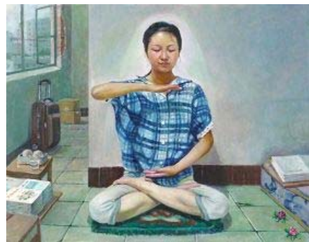
油画：大法弟子打坐炼功

密麻麻的小疙瘩，小疙瘩上面有个小黄尖，里面是一包黄水，特别痒。通过学《转法轮》，我知道是大法师父把病根摘掉了，毒气打出来了。我感到身体有劲了，能给孩子洗三件小衣服。第五天小黄尖都破了结了痂，乳房肿瘤消失。