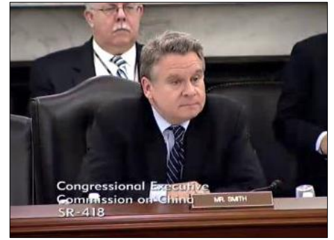
图：美国国会及行政当局中国委员会主席克里斯·史密斯议员

专门针对中共活摘器官的新法案，严惩犯罪者，即任何在中国犯下此罪行的人及其亲属申请美国签证都将永远被拒绝，他们的子女也无法来美国上学。