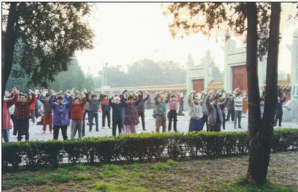
1999年7.20迫害前，法轮功学员在北京地坛公园集体炼功

这一夜我不断想着师父的法：“欠债要还，所以在修炼的路上可能要发生一些危险的事情。但是出现这