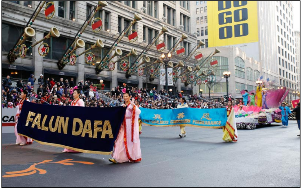
美中法轮大法学会第十年受邀参加麦当劳感恩节游行

“真、善、忍”的横幅紧随其后，大型莲花花车缓缓行驶，身着彩色炼功服的学员演示着法轮功功法，气氛祥和。花车后面的队伍中，学员们手执写有“法轮大法令人身体健康、心灵平和”、“法轮大法好”和“真、善、忍好”等中英文字样的旗帜。解说员一遍遍地向人们介绍着法轮大法的