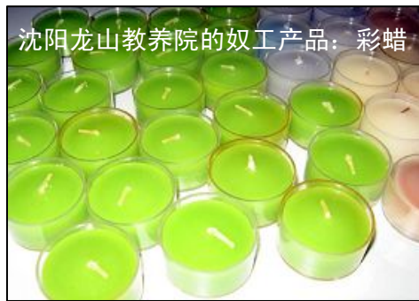
沈阳龙山教养院的奴工产品：彩蜡