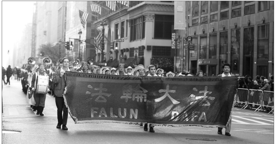
二零一二年纽约老兵节游行中法轮功学员的队伍

到的是我们邀请到的法轮大法游行队伍，他们是退伍军人节游行的老朋友，他们传递着‘真、善、忍’的美好信息，请大家掌声欢迎他们！”