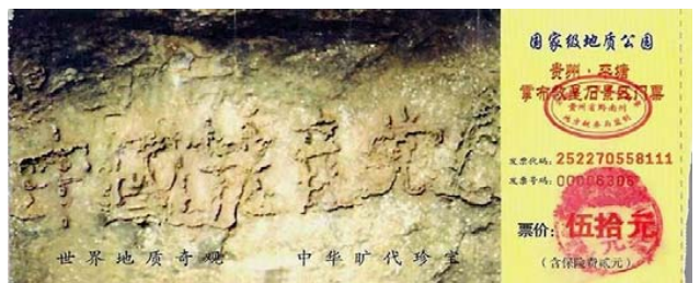
图：贵州平塘县掌布乡藏字石风景区门票

中国人在加入少先队、共青团、共产党时，都曾宣誓要为它奋斗一生，献出生命，这等于是发了一个毒誓，如果不退出，就是它的一份子，就要分担它的罪恶与恶果，就会在天灭中共的天象变化中遭劫难。所以法轮功学员讲真相、劝“三退”（退党团队），与“搞政治”毫不沾边，他们是在救人！让人在天灭中共时不做它的陪葬，从而有个美好的未来。◇