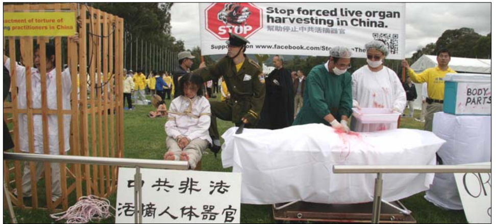
图：国会大厦前模拟演示，揭露中共酷刑迫害法轮功学员并活体摘取器官。

来自美国的智库研究员伊森·葛特曼先生是作家及研究者，也是调查法轮功学员和其他一些政治犯被中共活摘器官的主要独立调查员之一，同时是《失去新中国》一书的作者及《亚洲华尔街日报》等刊物的撰稿人。他与悉尼大学药理学和运动科学教授菲尔特罗内·辛格在研讨会上就中共谋杀法轮功学员，非法摘取和出售他们器官的指控及对指控进行的调查做了详尽的介绍。