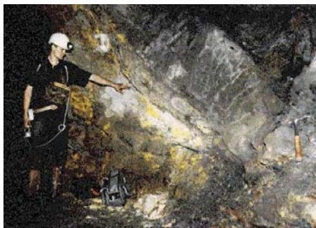
图：美国航天局 2005 年 2 月 20 日公布 20 亿年前的核反应堆图片。

法国政府宣布了这一发现，震惊了世界，并吸引了各国的科学家们来到奥克洛研究，研究成果在 1975 年国际原子能委员会的一个会议上公布：这是一个大型的、天然核反应堆，由六个区域约 500 吨铀矿石构成，输出功率估计为 100 千瓦。核反应堆为二