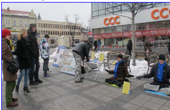
图: 法轮功学员在波兰琴斯托霍瓦传播真相

当天琴斯托霍瓦市《城市生活》网站就以《发生在中国的迫害》为题,详细报道了发生在中国持续十二年的迫害与反迫害的正邪较量,地方电视台也同日播出相关视频报道。