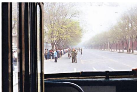
图为“4·25”当天在公共汽车中拍摄。注意：中南海的红墙在人群对面，警察在闲聊，街上能看到自行车行驶，根本不存在什么“围攻”。

今天，人们在回顾这一栽赃时，可以更清楚地看出实质：法轮功讲“真善忍”；共产党讲假恶斗，与中华传统道德价值完全相悖。因此，中共在抛出“围攻中南海”谎言的前三年，就有预谋地系统实施对法轮功的打压了。从 1996 年《光明日报》的舆论攻击开始，到禁止出版法轮功书籍，到江、罗一伙扣押国务院总理朱