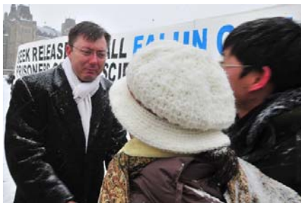
国会议员罗伯·安德斯为法轮功学员经历磨难、矢志不渝的精神感动落泪

加拿大保守党国会议员伽利·波利克鲁兹、罗伯·安德斯、斯蒂芬·伍德斯以及绿党领袖、国会议员伊丽莎