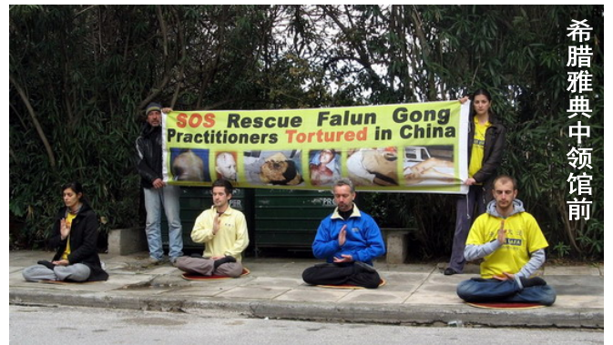
希腊雅典中领馆前

【明慧网】1月27日，十三个国家的法轮功学员和支持者，于中午12~13点全球同一时间段里，在各自国家的中使馆前举行了“抗议中共迫害法轮功”的活动。提醒人们，在国际大屠杀纪念日之际，不要漠视目前在中国大陆发生的包括屠杀在内的各种严重罪行。大量法轮功学员遭到绑架、抄家、囚禁、酷刑、虐杀、活摘器官盗卖。中共所犯下的群体灭绝罪和反人类罪，是对全人类的挑战和亵渎。