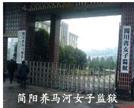
简阳养马河女子监狱