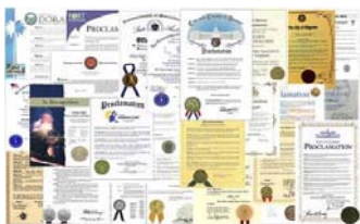
李洪志先生和法轮大法获得各国政府各类褒奖、支持决议案和信函超过3000项（上图部分褒奖）。