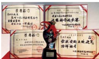
1993年北京东方健康博览会上，李洪志先生获“边缘科学进步奖”和“受群众欢迎气功师”称号。

● 福益社会 1998年下半年，前人大老干部对法轮功进行了数月的调查，得出“法轮功于国于民有百利而无一害”的结论，并于年底向中央政治局提交了调查报告。