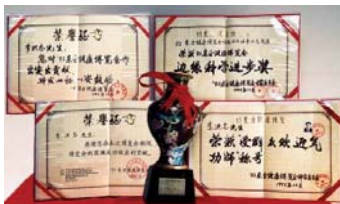
1993年北京东方健康博览会上，李洪志先生获“边缘科学进步奖”和“受群众欢迎气功师”称号。

● 福益社会 1998年下半年，前人大老干部对法轮功进行了数月的调查，得出“法轮功于国于民有百利而无一害”的结论，并于年底向中央政治局提交了调查报告。