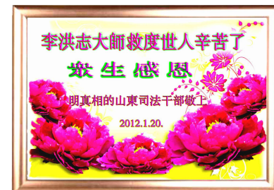
明真相的山东司法干部恭祝李大师新年快乐！