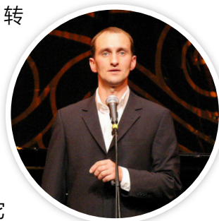
米歇尔在伦敦伊丽莎白女王厅演出

“我内心十分清醒 / 故贪婪、恐惧和痛苦没有它们的位置 / 我开始感到宁静 / 因为我思想 / 拥有这些真理……”