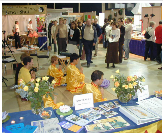
法轮功学员在维也纳健康博览会 演示法轮功功法