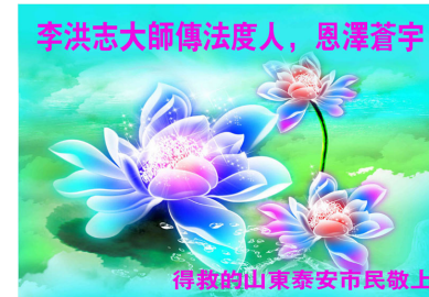
山东泰安市民恭祝李大师新年快乐！