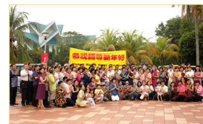
马来西亚雪隆区大法弟子恭祝师尊新年好！