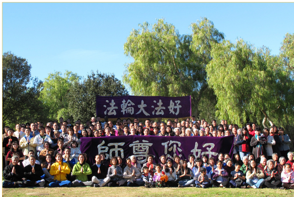
美国洛杉矶大法弟子恭祝师父新年好！

壬辰年（2012年）新年之际，海外 100 多个国家的法轮功学员也纷纷以各种方式恭祝慈悲伟大的师尊新年快乐，感谢师尊的慈悲救度！