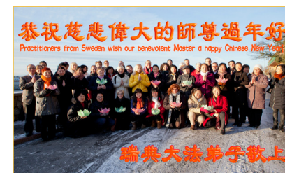
瑞典大法弟子给师尊拜年！