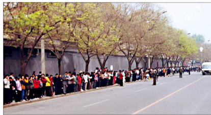
四·二五现场，秩序井然

“四·二五”当晚，江泽民出于妒忌，把和平上访歪曲成“围攻中南海”，并于1999年7月20日开始全面迫害法轮功。