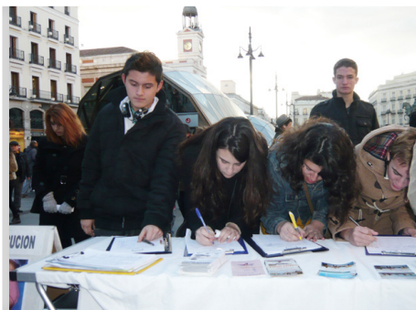
大学生前来签名声援法轮功