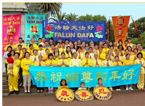
墨尔本大法弟子恭祝师父新年好！