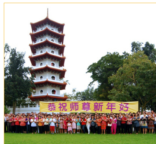
新加坡大法弟子在裕华园向师父拜年，恭祝师尊新年好！