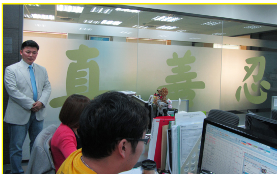
“真、善、忍”三字 成为员工共同崇尚的理念

德生富贵，正心而经商。虽然经商都以盈利为目的，但做人的道德仍然是商人首先要遵循的根本。“真善忍”的理念促进道德的向善与回归，也必然带来经济的健康发展和真正昌盛。能将这种精神世代传承，则可获得真正的永续经营！