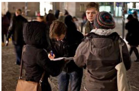
明白真相的人们签名支持反迫害

全球十三个国家的法轮功学员和支持者，都在这一天，在各自国家的中使馆前举行了“抗议中共迫害法轮功”的活动。提醒人们，不要漠视目前正在中国大陆所发生的种种罪行。中共对法轮功学员犯下的“群体灭绝罪”和“反人类罪”，是对全人类良知的挑战和亵渎。