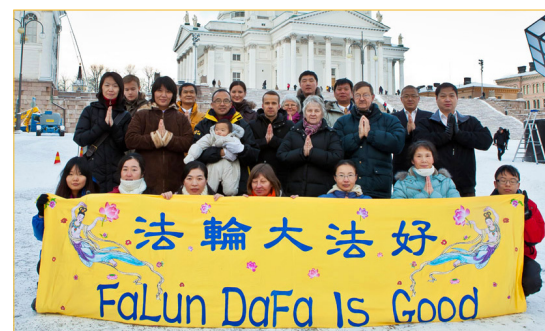
芬兰大法弟子恭祝师父过年好！