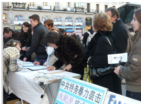
各界人士排队等候签名声援反迫害

中国新年前，西班牙法轮功学员在首都马德里市中心卡约尔广场举行集会，呼吁制止中共迫害法轮功。了解了真相的人们，纷纷签名支持法轮功反迫害。