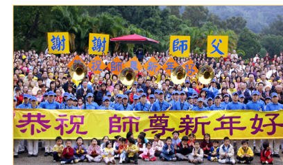
台湾台北大法弟子恭祝师尊新年好！