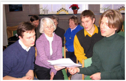
两个帅小伙（左一、右二） 和法轮功学员一起学法

芬兰法轮功学员中有三位公认的“帅小伙”，谁又会想到，修炼前他们个个是留着长发、抽烟、喝酒、有不良习惯、让家长操心的“问题男孩”！现在他们三人，两人上了大学，另一人有了正式工作。三人的家长非常欣慰，并支持他们修炼法轮功。