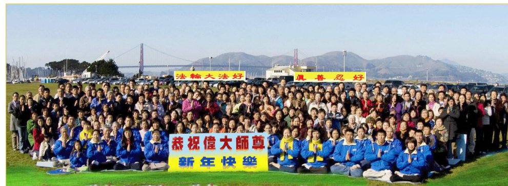
旧金山湾区大法弟子恭祝师父新年好！

2012年1月31日，漫天飞雪，在加拿大国会山的广场，来自多伦多、蒙特利尔、滑铁卢、渥太华等地的三百多名法轮功学员，打出巨型横幅，在严寒中静静炼功，请愿，呼吁即将出访中国的加拿大总理斯蒂文·哈珀向中共当局提出法轮功受迫害问题，要求释放所有受迫害的法轮功学员。