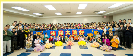
向慈悲偉大的師尊拜年！