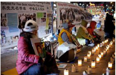
悼念被迫害致死的中国大陆法轮功学员

2012年1月27日是国际大屠杀纪念日，赫尔辛基部分法轮功学员在芬兰中使馆门前和平抗议，抗议中共对法轮功的残酷迫害，并在火车站举行烛光守夜活动，悼念那些被中共迫害致死的中国大陆法轮功学员。