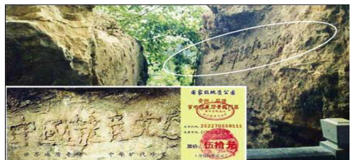
图为“藏字石”照片, 小图为“藏字石”风景区门票。

希望善良、理性的简阳父老乡亲, 一定要分清善恶正邪, 认清中共的所谓“承诺卡”签名活动的害人伎俩, 做出正确的选择。愿您拥有美好的未来。◇