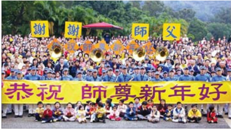
图：台北法轮功学员 2012 年新年谢师尊

台），受到世界人民的爱戴和尊敬。仅台湾一地，1999年江泽民集团迫害法轮功之后，学员人数增加了十多倍，已突破数十万之众。