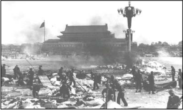
图：六四凌晨，中共军人在天安门广场上转移和焚烧尸体。

天安门广场并没有陈列灭火器，何以在“自焚者”点燃身上汽油的短时间内，就有这么多灭火器“救火”？