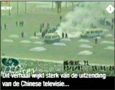
图：荷兰国家电视一台 2005 年 3 月 14 日《时事评论》专题播放法轮功节目，并揭露中央电视台“自焚”伪案，质疑突发事件中两辆警车为何备有（据中共媒体报导）20 多个灭火器。

近及通往广场的道路沿线屠杀市民和学生，却称学生和市民搞暴乱，并谎说戒严部队在天安门广场执行清场任务中“没有死一个人，没有轧伤一个人。”