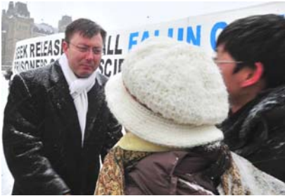
图：加拿大国会议员罗伯·安德斯感佩法轮功学员的矢志不渝

二零一二年一月二十九日傍晚，澳大利亚悉尼市政厅举办庆祝中国新年大游行，超过十万观众沿