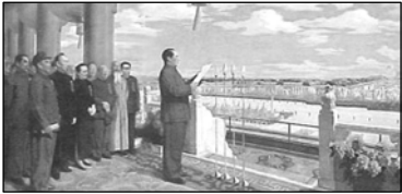
图：一幅画都要随政治动荡而改来改去，何况生活在那里的人呢？