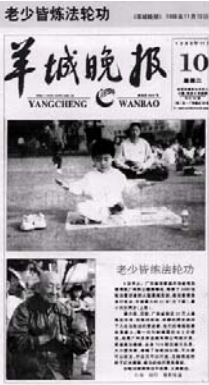
羊城晚报：《老少皆炼法轮功》

● 法轮大法弘传世界 李洪志先生和法轮大法因对人类身心健康做出的杰出贡献，获得各国政府褒奖 1000 多项。法轮功书籍被译成 30 多种语言，在全世界出版发行，并可在网上免费下载。至今法轮功已弘传一百多个国家和地区（包括港澳