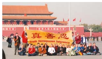
图：12 国的 36 名西人法轮功学员到天安门告诉中国人真相。2001.11

当然，天安门广场上，也留下了世界各地的法轮功学员跨越千山万水，前来告诉中国人真相的壮举。事实是掩盖不住的，重要的是人们如何敞开心扉面