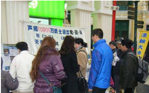
图：2012 年新年，澳门玫瑰堂法轮功真相点。很多人买了年货，又做了三退（退党、退团、退队），还带了《九评共产党》与破网软件高兴地回家过年。

中共对法轮功的迫害，是邪恶对善良的打压，是中共对中华民族道德的再次摧毁，这个时候，作为中国人还有保持中立的余地吗？其实有意无意的中