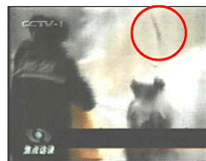
2、击打后飞出的重物