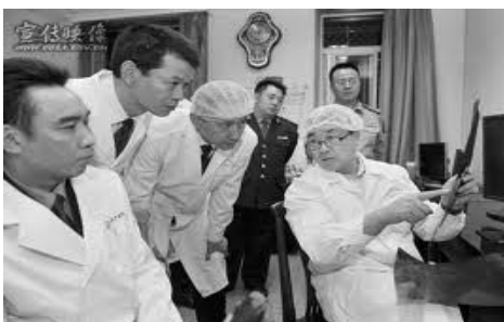
图:王立军(右一)2008 年 6 月调任重庆,指示重庆警局要加快无创解剖的实践应用

然而,不相信神并不等于神不存在;不相信因果报应,并不会不受天理的制约。古话说:“自古机深祸亦深,休贪富贵昧良心。檐前滴水毫不错,报应昭昭自古今。”(文/德元)