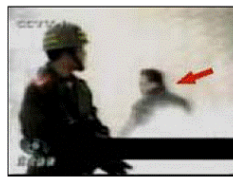
4、击打者仍保持用力姿势