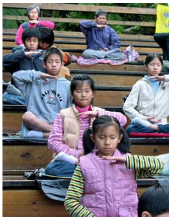
二零零九年台北明慧夏令营参与者午餐后炼法轮功第五套功法

两个月过去了，他身上的恶根似乎很难去除，很容易故态复萌，但变化还是在一点点发生着。除了请老师外，我时常睡前给他讲生活、讲历史故事，讲法轮大法的