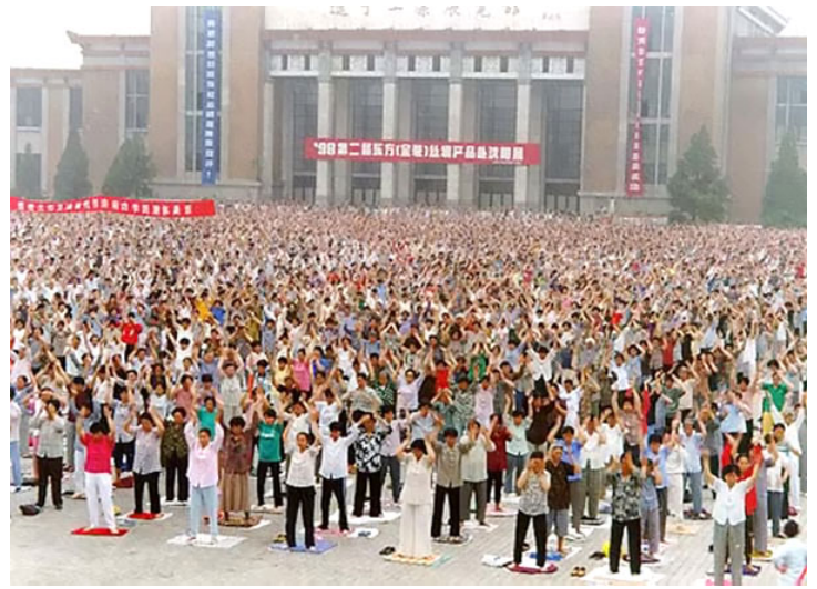
图：1998 年 5 月沈阳万人集体大炼功场景

法轮大法自 1992 年 5 月公开向社会传出以来，短短的七年时间里，在全世界吸引了上亿有志有识之士。大法修炼不求名、不求利，强调用“真善忍”的法理约束自己。无论男女老幼，无论来自哪个国家、民族，只要坚持修心炼功者无不深深受益。在 1993 年北京东方健康博览会上（左图），法轮功创始人李洪志先生获博览会最高奖“边缘科学进步奖”，和大会的“特别金奖”，以及“受群众欢迎气功师”称号，是该届博览会上荣获奖励最多的气功师。如今法轮大法已收到来自世界各国的褒奖、支持议案和信函超过 3200 项。◇