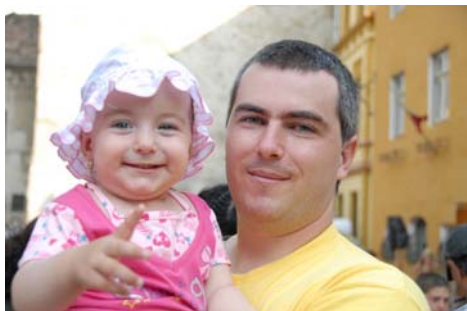
图：库奇和他可爱的女儿

罗马尼亚的库奇，是一位计算机程序员，当得知自己得了青光眼，眼压很高，不久后可能失明时，他到处看医生，正在他焦头烂额的时候，一