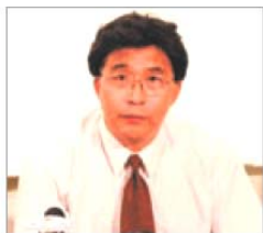
韩广生 前沈阳司法局局长