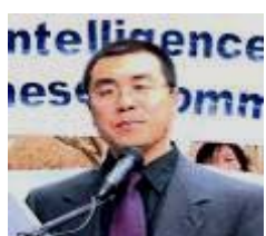
李凤智 前国安部对外情报官