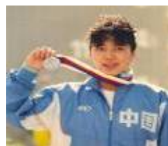
黄晓敏 前奥运游泳名将