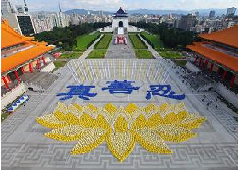
二零一零年十一月二十七日，五千多名法轮功学员在台北自由

法轮功强调重德修善，祛病健身效果卓著，不收金钱、来去自由的修炼形式，不凭借广告宣传，仅以“人