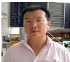
邱明伟 前人民日报副主任