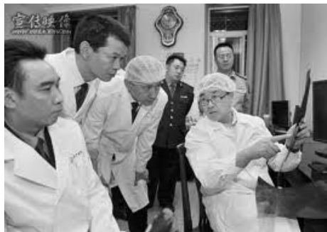
图：王立军（右一）2008 年 6 月调任重庆，指示重庆警局要加快无创伤解剖的实践应用

2012 年 2 月 6 日，现任重庆市副市长，前重庆市公安局局长王立军突然进入美国驻成都领事馆，紧接着重庆市政府宣布王立军接受“休假式治疗”。王立军进得了领馆，却得