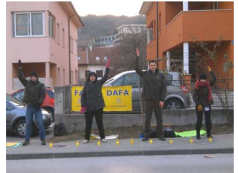
图：克罗地亚共和国首都萨格勒布法轮功学员在中使馆对面反迫害

一月二十七日参加这次多国携手声援抗议活动的国家还有欧洲的波兰、塞尔维亚、斯洛伐克、波斯尼亚，亚洲的印度尼西亚，北美的墨西哥和南美的巴西。