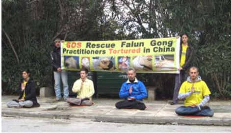
图：希腊法轮功学员在中使馆对面反迫害

【明慧网】二零一二年一月二十七日，欧、亚、美洲的十三个国家的法轮功学员和支持者们，于中午 12 点至 1 点全球同一时间段里，在各自国家的中使馆前举行了“抗议中共迫害法轮功”的活动，提醒人们在国际大屠杀纪念日之际，不要漠视目前在中国大陆发生的包括屠杀在内的各种严重罪行，大量法轮功学员在遭受中共的肆意绑架、抄家、囚禁、酷刑、虐杀、活摘器官盗卖。中共对法轮功