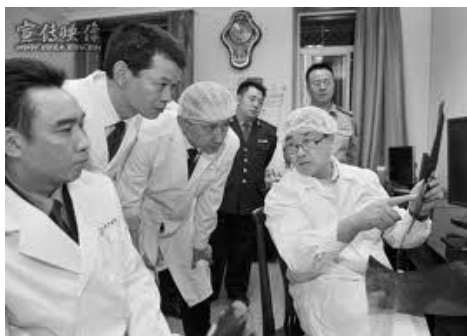
图: 王立军 (右一) 2008 年 6 月调任重庆, 指示重庆警局要加快无创解剖的实践应用

祖上必有余殃, 殃尽乃昌; 作恶必灭, 若作恶不灭, 祖上必有余德, 德尽即灭。 善恶报应是天理。