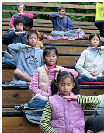
二零零九年台北明慧夏令营参与者午餐后炼法轮功第五套功法

两个月过去了，他身上的恶根似乎很难去除，很容易故态复萌，但变化还是在一点点发生着。除了请老师外，我时常睡前给他讲生活、讲历史故事，讲法轮大法的