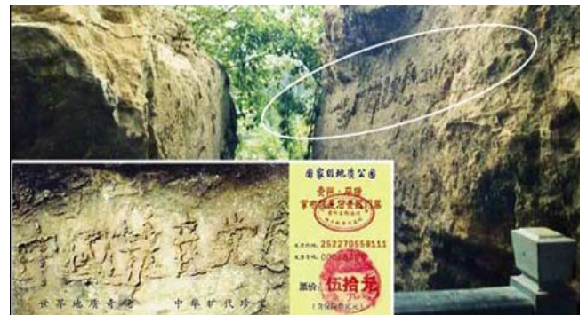
图为“藏字石”照片，左下小图为风景区门票。

千百年来中国，在要出大事之前就一定有奇事发生，老天或以瑞兆示吉，或以凶相警世。今天，贵州平塘的“藏字石”突现标语“中国共产党亡”，非同小可，绝非偶然。这是否也在向人们预示着天机呢？