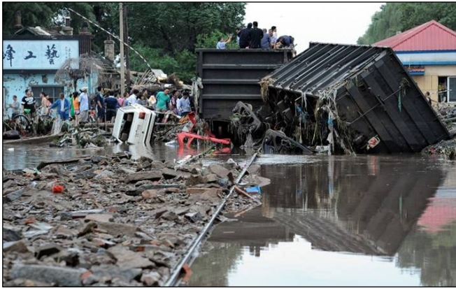
图：2010年7月28日吉林省永吉县全城被水淹没，城中水深一度达到5米多，火车车厢被冲上大街。

母亲常常在李洪志师父的像前双手合十，感恩李大师多次救了她的命。母亲还说，七八十年前她生孩子时得了腰痛病，自从她诚念“法轮大法好”以后再也没有痛过了。