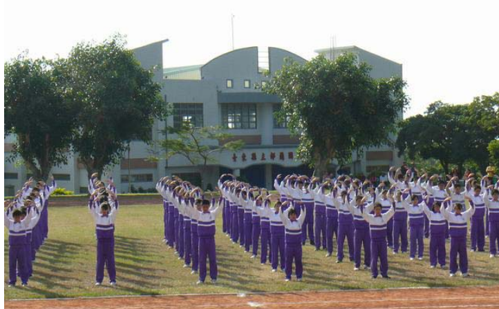
图：二零零九年十二月十一日，台湾台东县都兰国中校庆运动大会开幕典礼上全校一百多位学生表演了法轮功五套功法，动作整齐、优美，让家长 and 来宾十分赞叹。