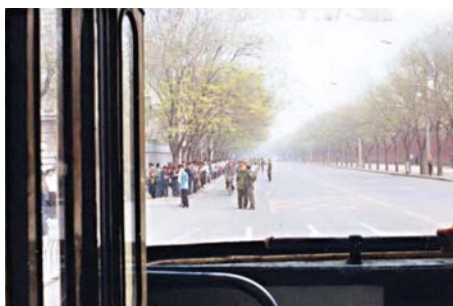
图为“4·25”当天在公共汽车中拍摄。注意：中南海的红墙在人群对面，警察在闲聊，街上能看到自行车行驶，根本不存在什么“围攻”。

今天，人们在回顾这一栽赃时，可以更清楚地看出实质：法轮功讲“真善忍”；共产党讲假恶斗，与中华传统道德价值完全相悖。因此，中共在抛出“围攻中南海”谎言的前三年，就有预谋地系统实施对法轮功的打压了。从 1996 年《光明日报》的舆论攻击开始，到禁止出版法轮功书籍，到江、罗一伙扣押国务院总理朱