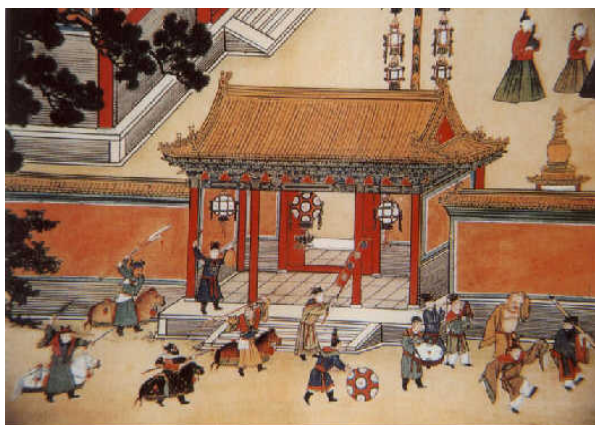
上图：元宵节灯会娱乐图