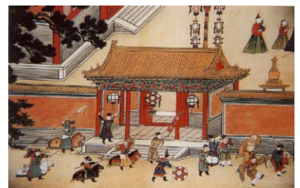
元宵节宫廷娱乐图

中华传统文化讲天人合一，五千年的神传文化为后世留下了辉煌的智慧。中共篡政后，强制灌输无神论，“战天斗地”，发动多次政治运动，将中华正统文化内涵割断，人们不再相信善恶有报，不信天理昭昭，道德下滑一日千里。而传统节日中那些徒具形式的活动在本质上已经变异，不再具有净化人心灵的道德效力了。◇