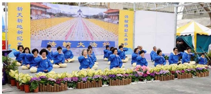
上图：二零一二年元宵节台湾灯会之际，台湾法轮功学员在展示灯区向民众展示五套功法，图为第五套——神通加持法。