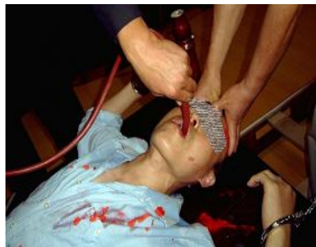
▲酷刑演示：野蛮灌食

我曾多次口头或书面表示：“坚修大法，按真善忍做个好人。”就这样我没有认罪认错。记得有一次