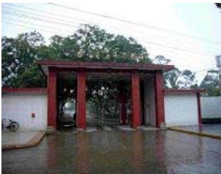
▲楠木寺女子劳教所，“官方”名字是“四川省女子劳教所”

七月的楠木寺闷热无比，每天只给一口水刷牙，一碗水洗脸、脚。一个多月不许洗澡，衣服发臭换下来也不许洗，又再接着穿。同我一起关小间的几个同修全身长满痱子、疥疮，奇痒难忍。有几次因帮教打手骂我的师尊，我把眼