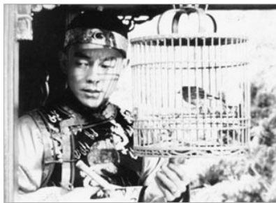
姜光宇《雍正王朝》剧照

编者按：中国法轮功修炼者有一亿人，遍及各个行业。姜光宇是中国大陆一位知名的青年演员。他在《雍正王朝》中扮演雍正皇帝之子弘时，即弘历（后乾隆皇帝）之兄。姜光宇因为修炼法轮功，在中国为法轮功上访说公道话，不容于中共当局。但他宁可放弃名利，不放弃自己对“真善忍”的信仰和追求，让我们听听他的心路历程和遭遇。