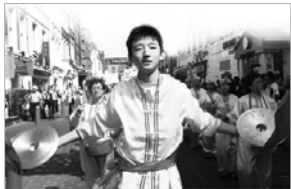
阳阳在唐人街参加游行

阳阳笑了：“很多人说他们长大了想当律师、当科学家、当总经理，但很多理想都实现不了。我什么都不想，我就做好每天该做的，一切随缘吧。”